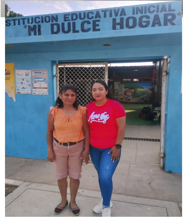
Visitas a la Institución educativa con la directora encargada