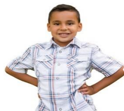
5 años de edad