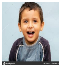
3 años de edad