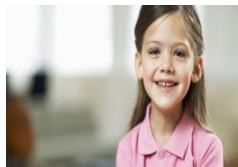
4 años de edad