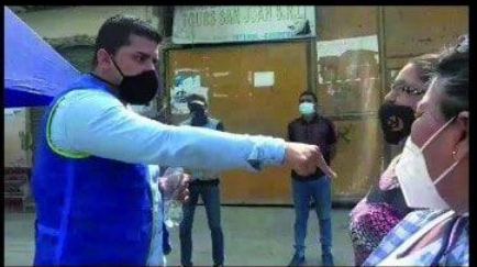
El dictador de la Municipalidad de Tumbes le baja el dedo a los comerciantes de Tumbes