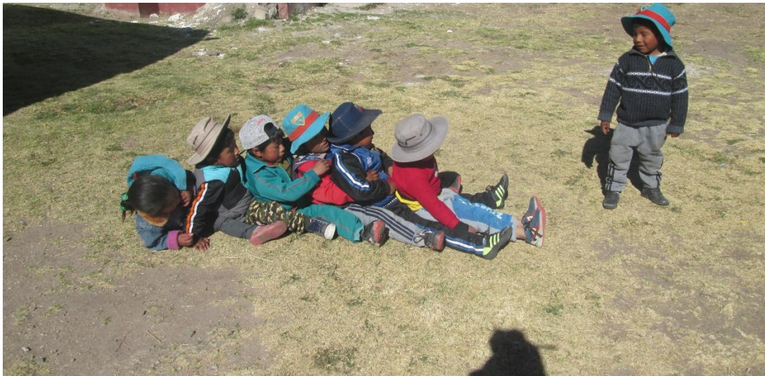
Niños y niñas socializándose a través de los juegos.