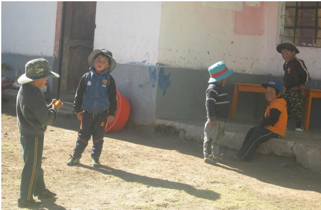
La práctica de los juegos en la educación formal