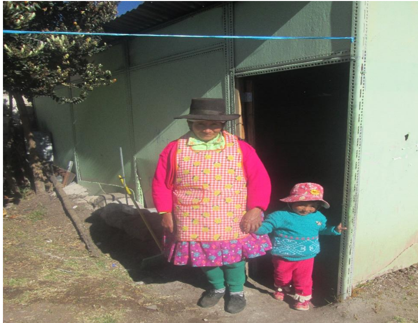
Niños aprovechando el recreo para jugar al trompo.