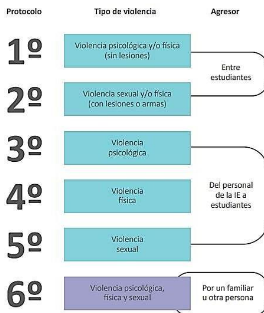
Figura 3: Protocolos según tipo de violencia y agresor.

Nota. El esquema representa la descripción de los seis protocolos de atención oportuna a la violencia escolar