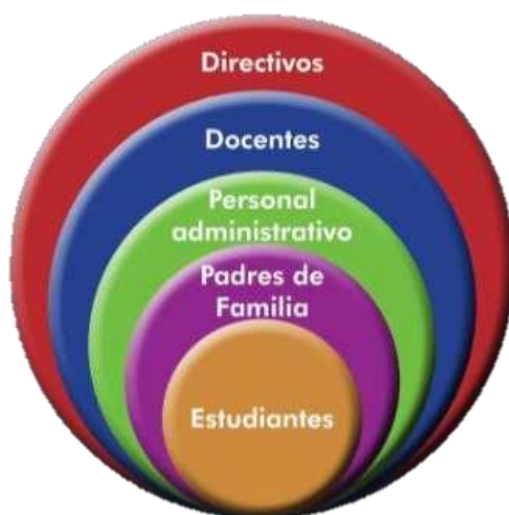
Figura 1: Convivencia escolar democrática

Se entiende entonces que la convivencia escolar es el conjunto de interrelaciones que se dan en el centro escolar, construyéndose en forma colectiva y con responsabilidad compartida de la comunidad educativa, es parte de la gestión escolar, considerando las relaciones interpersonales, la calidad del desarrollo de los aprendizajes y el clima de la escuela (MINEDU,2106).