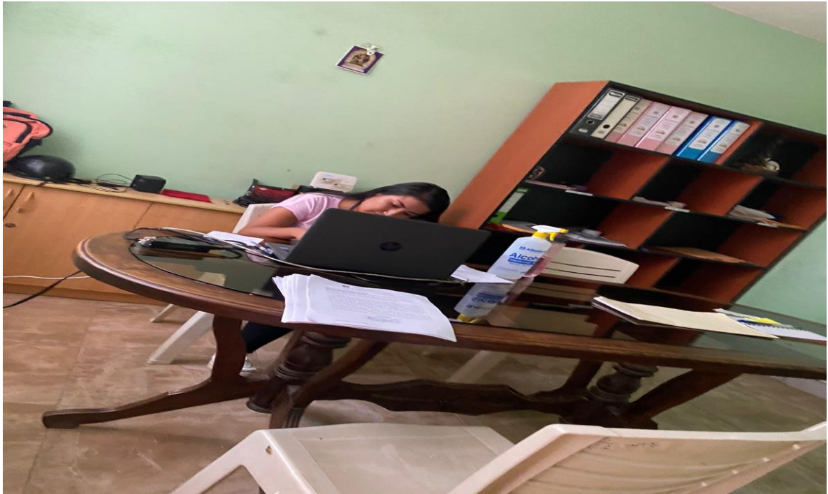
Toma fotográfica 1: Trabajadora llenando la encuesta de gestión administrativa