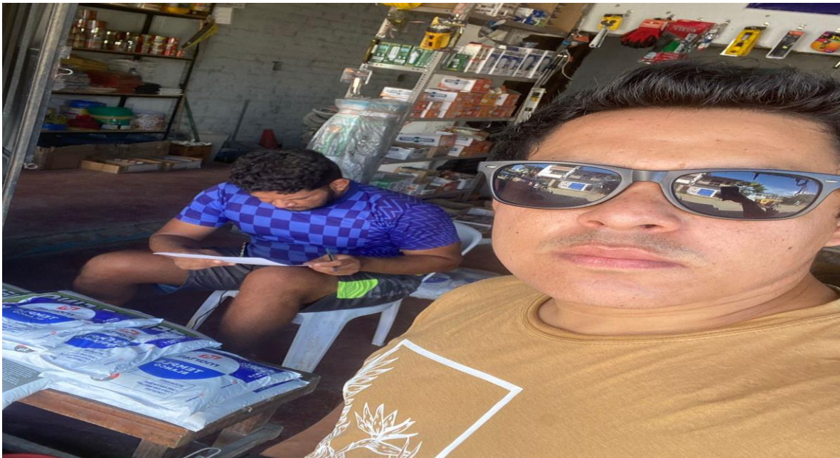
Toma fotográfica 2: En su domicilio, poblador corraleño llenando la encuesta de responsabilidad social