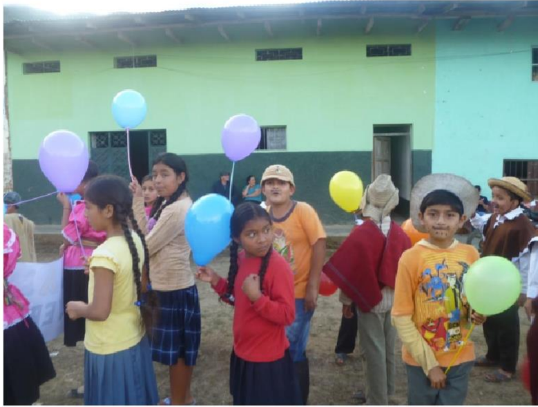
Alumnos participando de los juegos deportivos intersección que ayudan a desarrollar la autoestima y el compañerismo