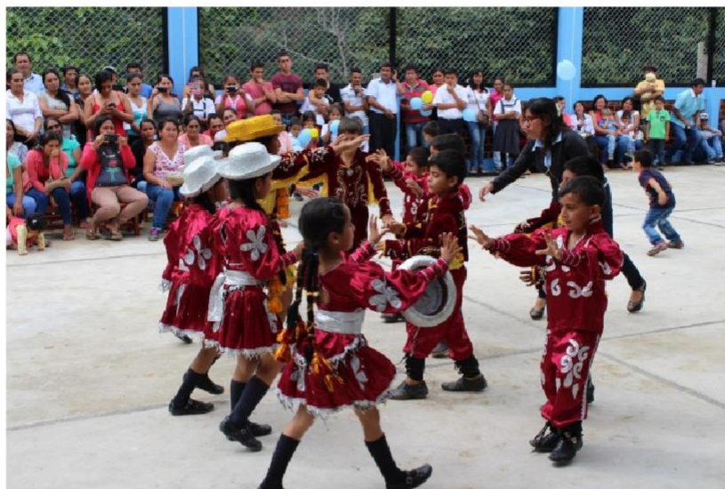
Participando en los juegos florales de red