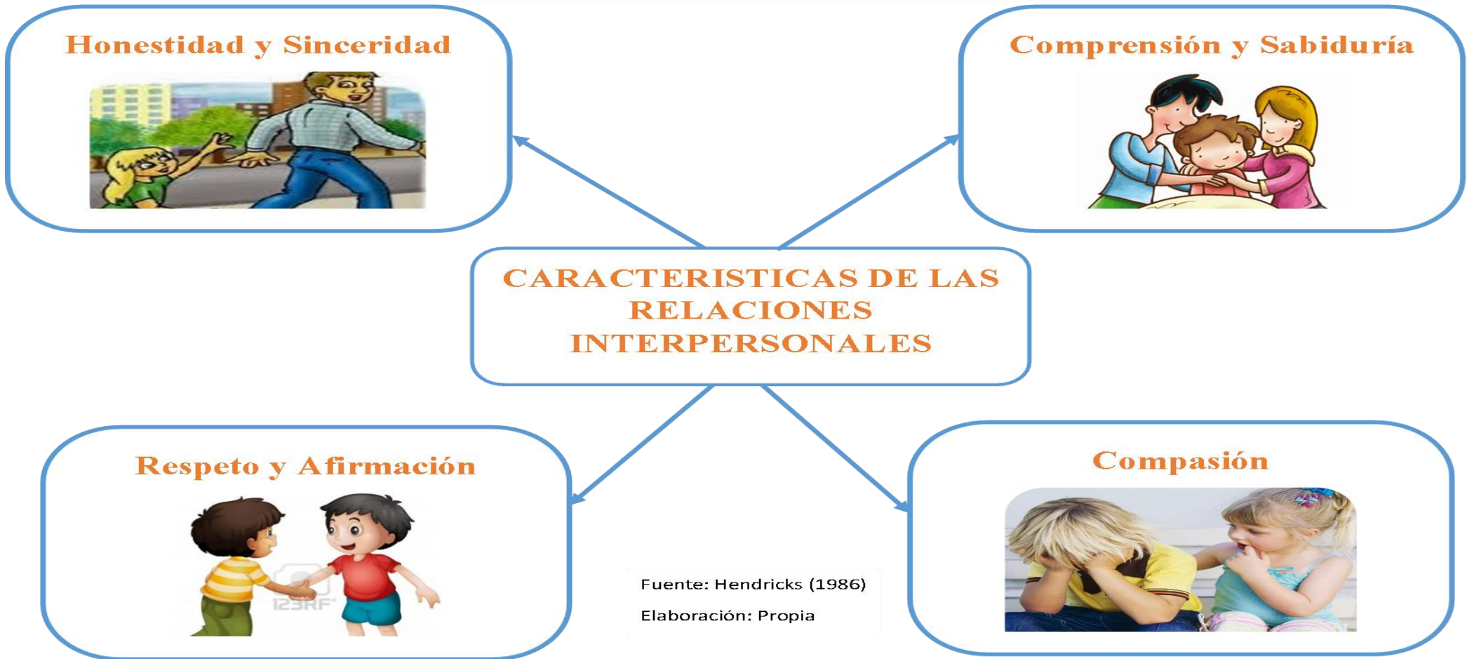
GRAFICO N°01: CARACTERISTICAS DE LAS RELACIONES INTERPERSONALES