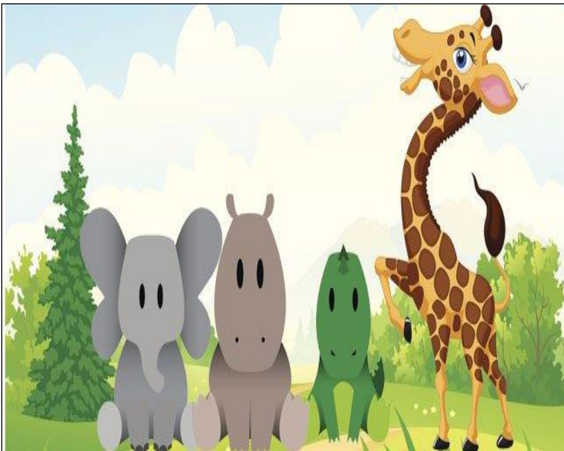
Anexo 2: Cuento "Uga uga la tortuga"