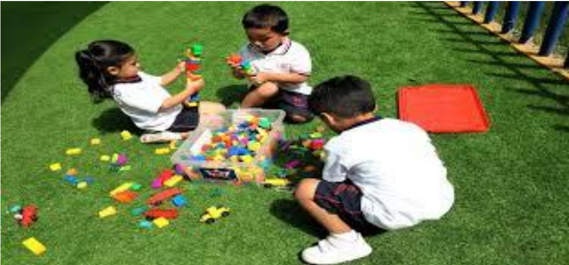
El juego como estrategia para fomentar el valor de la paz.