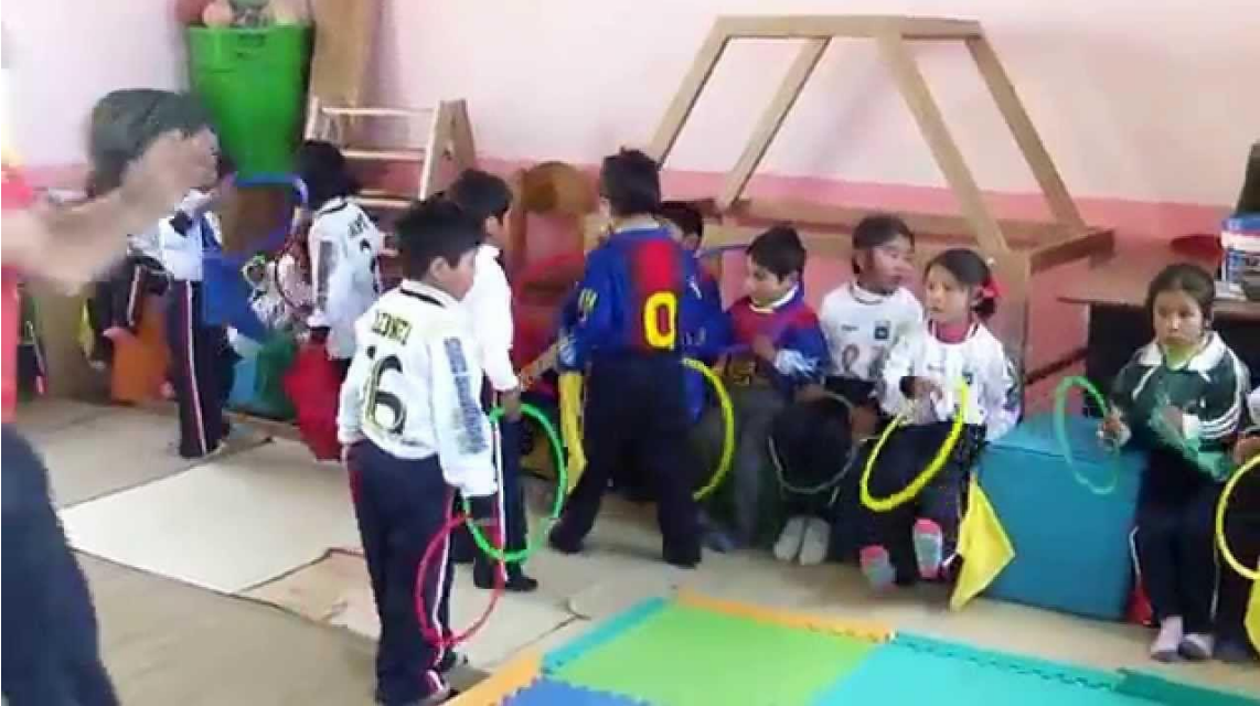
El juego como estrategia para fomentar el valor de la paz.