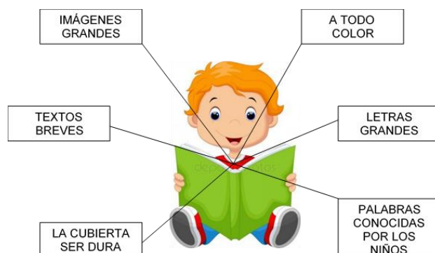
Figura 1. Características de los libros para los niños

Fuente: DALLEEN Rossy (2012) en el cuento en la expresión oral de los niños. Ediciones Propuesta Educativa. Año X, N° 20. Buenos Aires