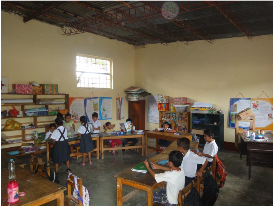
DESFILE POR FIESTAS PATRIAS