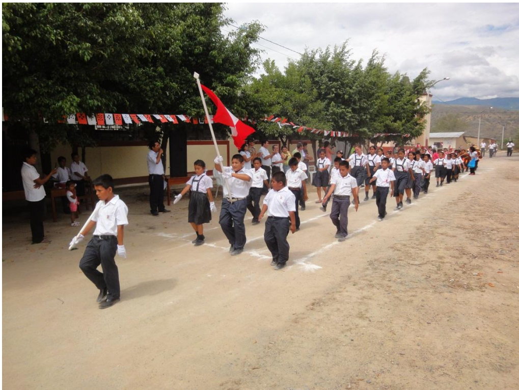
PADRES DE FAMILIA PARTICIPANDO EN LAS DIFERENTES ACTIVIDADES